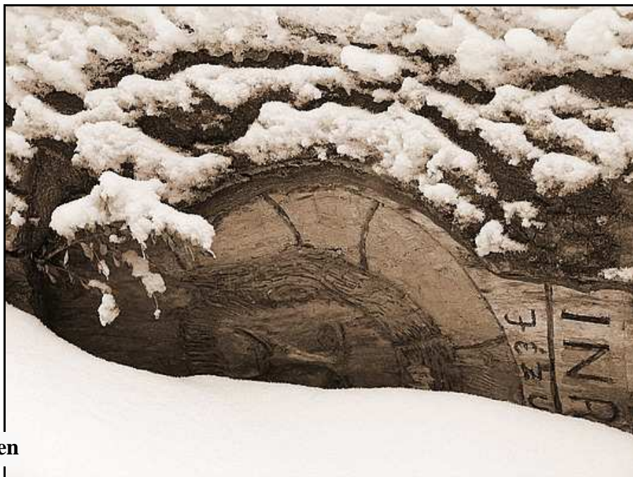
Tél a Vértesben