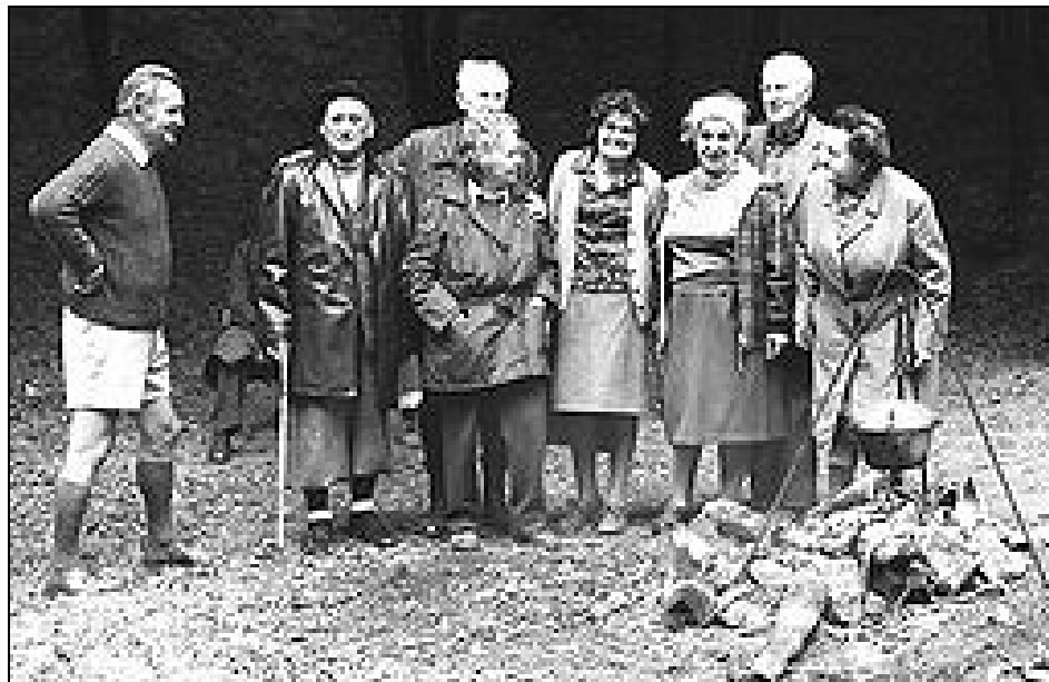
Egy csapat a 70-es évekből, akikre már csak emlékezünk!

UGYE NEM FELEJTETTED EL??? HOZZ MAGADDAL TE IS EGY ELDOBOTT PALACKOT AZ ERDŐBŐL, ÉS SZÓLJ A TÖBBIEKNEK IS!